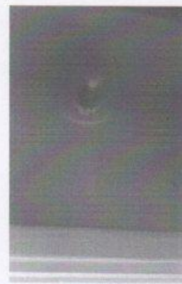
Группа ОНР 7