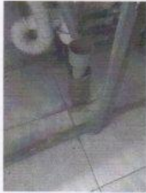
мочная ванна для мяса сырого