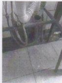
мочная ванна для рыбы сырой