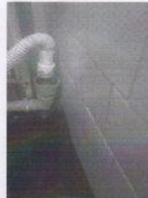
мочная ванна для овощей